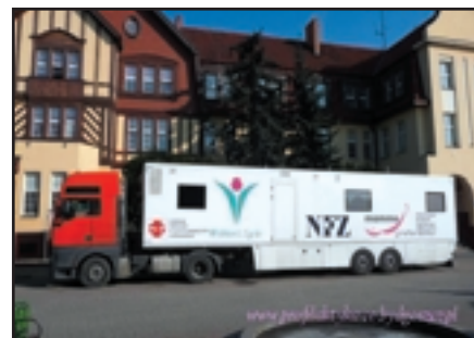
Cytomamibus z Centrum Onkologii w Bydgoszczy

Program ten w naszym regionie realizuje 18 ośrodków stacjonarnych i 5 mammoibusowych w etapie podstawowym oraz 2 ośrodki w etapie pogłębionym. Wykaz szczegółowy ośrodków realizujących dwa programy znajduje się na stronie internetowej www.wok.co.bydgoszcz.pl .