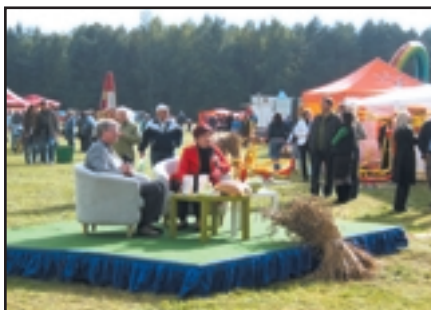
Akcja promocyjna „Fabryka zdrowia”

przed organizatorami skryningu, aby nakłonić kolejne osoby do skorzystania z badań profilaktycznych. Jedną z metod rekrutacji do badania są wysyłane na adres domowy zaproszenia. WOK w Bydgoszczy w ubiegłym roku i w I półroczu bieżącego roku wysłał 275 971 zaproszeń do badań mammograficznych i cytologicznych. Z zaproszeń tych skorzystało zaledwie ok. 13%. Dlatego też podejmuje się szereg dalszych działań, mających wpływ na poprawę świadomości zdrowotnej (programy TV i radiowe, artykuły prasowe, quizy, imprezy otwarte i inne).