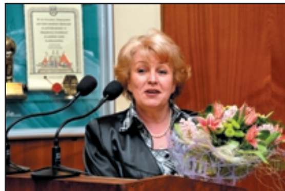
tekst ppor. I. Żuczek - Asystent ds. pielęgniarstwa