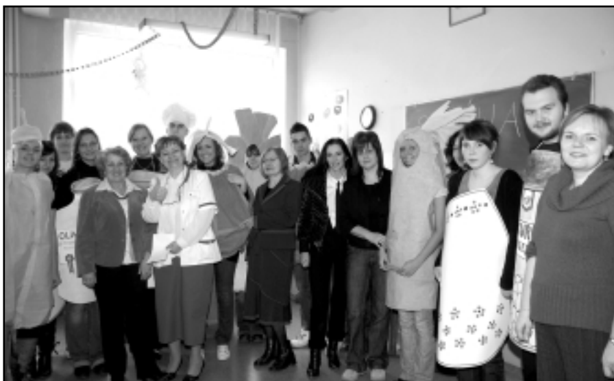
Uczestnicy Szkolnych Dni Nauki

„Pierwsza pomoc przedmedyczna”, „Ciało człowieka w języku angielskim i niemieckim”, „Gotuj z Pascalem”.