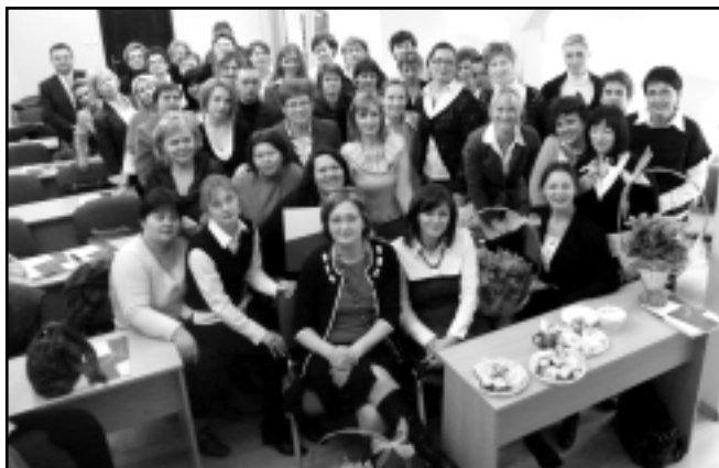
Uczestnicy Kursu dla Pielęgniarek i Pielęgniarzy rodzinnych po egzaminie

Dnia 18 stycznia 2009 roku zakończył się egzaminem kurs kwalifikacyjny w dziedzinie pielęgniarstwa rodzinnego dla pielęgniarek i położnych zorganizowany przez Klinikę ffx .