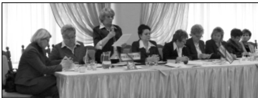
Prezydium XXIII Zjazdu