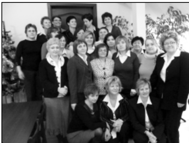
Uczestnicy Kursu dla Położnych rodzinnych po egzaminie

Przez prawie 4 miesiące spotykaliśmy się w każdą sobotę i niedzielę z 44 Pielęgniarkami i Pielęgniarzami oraz 22 Paniami Położnymi.