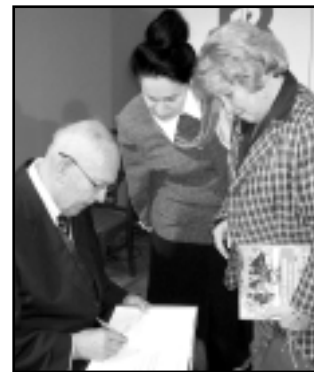
Autor książki podpisuje dedykację dla OIPIP

promującym książkę „Od warsztatu balwierskiego do szpitala klinicznego. Z historii bydgoskiego lecznictwa”