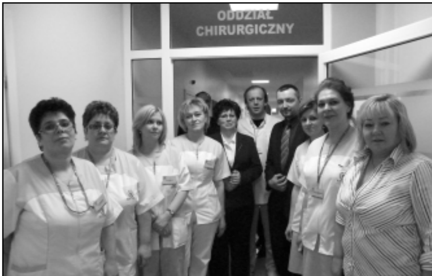
Zespół Oddziału Chirurgii wraz z zaproszonymi gośćmi

Poprawiły się zarówno warunki dla pacjentek, jak i warunki pracy dla personelu. Oddział posiada przestrzenny gabinet zabiegowy oraz pomieszczenie przygotowawcze.