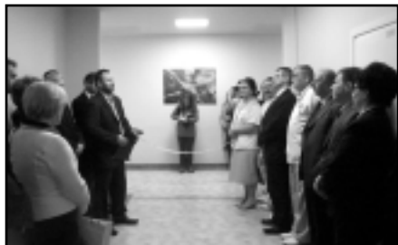
Uroczystość otwarcia oddziałów po remoncie

10 marca 2009 roku w NZOZ „Nowy Szpital w Nakle i Szubinie” sp. z o.o. zostały uroczystie otwarte po kompleksowym remoncie oddziały Ginekologii i Chirurgii ogólnej z pododdziałem chirurgii urazowo-ortopedycznej i urologii w Nakle nad Notecią.