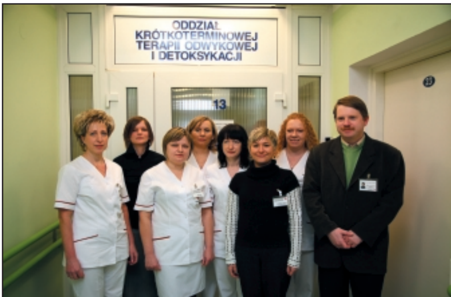
Personel Oddziału Krótkoterminowej Terapii Odwykowej i Detoksykacji dla Kobiet (na zdjęciu od lewej strony)

od alkoholu lub/i benzodiazepin, - stan po napadzie padaczkowym w przebiegu ZZA lub/i uzależnienia od benzodiazepin, - halucynozja alkoholowa, - zespół Wernickiego-Korsakowa.