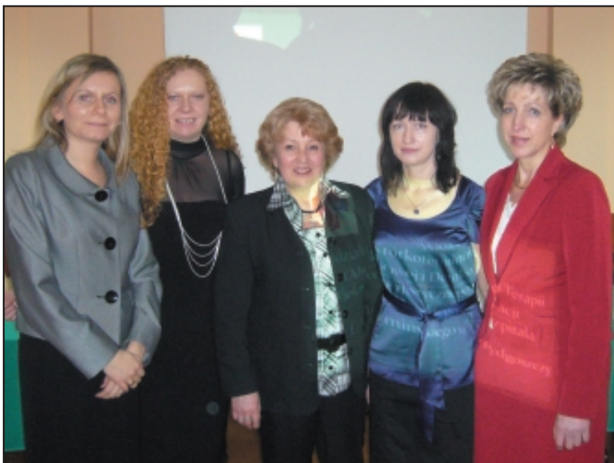
Pani Przewodnicząca wśród Pielęgniarek